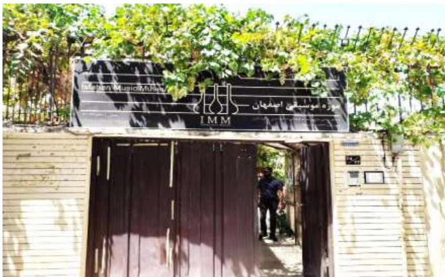
شکل ۱۷- موزه موسیقی اصفهان