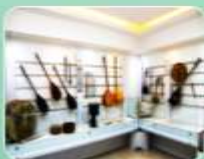
دید و منظر: عمدتاً منظرهای کنج دار با نمای قفسه های ردیفی و شبکه ای