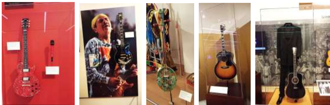
شکل ۳ تا ۱۵- موزه ادوات موسیقی فونیکس