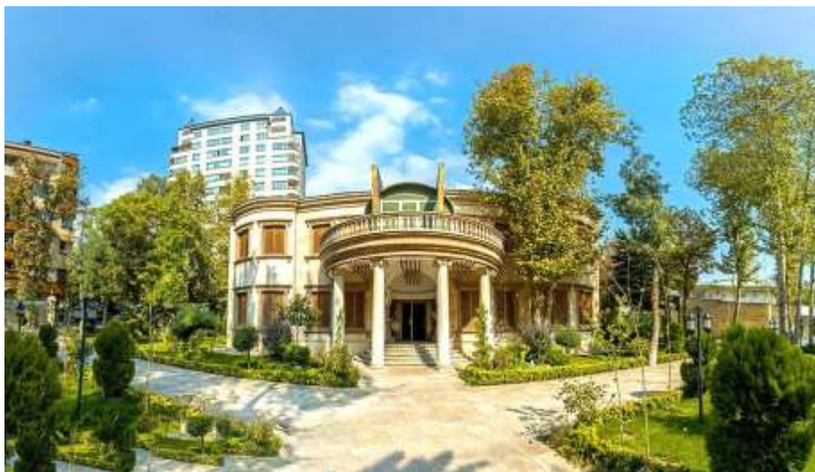
شکل ۱۶- موزه موسیقی ایران