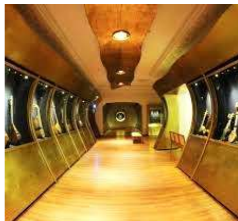
شکل ۲۲- فضای داخلی گنجینه، بخش تکمیلی موزه