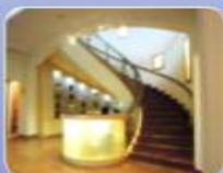
سیرکولاسیون: عمدتاً به صورت راهرویی و بعضاً همراه با فضای تقسیم مرکزی

در موزه های موسیقی ایران، غالباً از ابتدا طرحی بر اساس برنامه ریزی فیزیکی در نظر گرفته نشده است مثلاً در موزه موسیقی ایران در تهران و موزه موسیقی اصفهان، با احیای عملکردی نوعی خانه تاریخی، تأسیس شده اند. معماری و معماری داخلی همزمان و متناسب با شکل زندگی مسکونی ساختار اصلی بنا را شکل داده اند. پس از آنکه ساکنان اصلی خانه را ترک کرده اند، با گذر زمان بنا در معرض نابودی و تخریب قرار گرفته است. لذا معماری داخلی ساختار و کیفیت فضایی خانه را برای پذیرفتن کاربری جدید تغییر داده اند. در روند باززنده سازی بنا، بخش های اصلی خانه حفظ و به سالن های موزه تبدیل، بخش هایی مانند کتابخانه و گنجینه به آن الحاق و بخش هایی نظیر قسمت های خدماتی خانه حذف شدند و فضای داخلی موزه با فرم هایی ملهم از شکل ظاهری سازه ها طراحی شده اند. موزه های موسیقی ایران و اصفهان هر دو در خانه های مسکونی قدیمی پیش بینی شده اند. در موزه موسیقی ایران، تغییراتی در طراحی داخلی این فضاهای آن صورت گرفته که سیرکولاسیون حرکت و منظر زیبایی برای بازدیدکنندگان بوجود آورده و موجب جذابیت افزون تری برای بازدید کنندگان از موزه شده است. در موزه موسیقی اصفهان این تغییر در فضای حیاط صورت گرفته، جاذبه ی غالب در این موزه، در دسترس بودن سازها و پخش موسیقی زنده در فضاهای اصلی آن است.