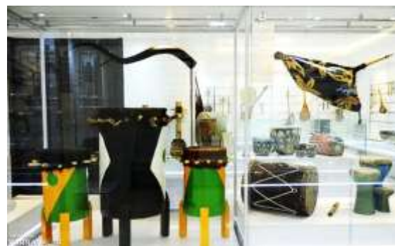
شکل ۳۰- سازهای زهی موزه موسیقی