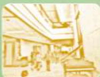
کانسپت معماری: عمدتاً فاقد کانسپت فرمی و همراه با ایده های متداول چیدمان در فضاهای سالن و گالری موزه و نمایشگاه

نمودار ۱- خصوصیات کلی سیرکولاسیون، دید و منظر و کانسپت معماری در موزه موسیقی ایران و اصفهان