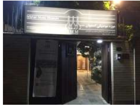
شکل ۲۶- حیاط موزه موسیقی اصفهان